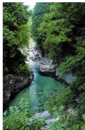
6 阿寺溪谷 木曾五木が茂る山が両岸に迫り、狸ヶ淵や犬帰りの淵など美しい溪谷美が続く。