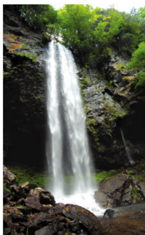
3 新滝 流れ落ちる滝をその真裏からも見ることができ「裏見滝」とも呼ばれる。木漏れ日の中、木々の緑に虹が見える情景は幻想的。