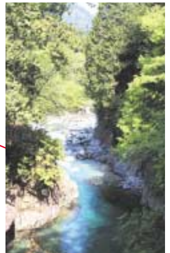
阿寺溪谷 木曽五木が茂る山が両岸に迫り、狸ヶ淵や犬婦りの淵など美しい溪谷美が続く。