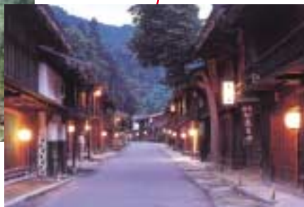
妻籠宿：全国で初めて古い町並みを保存した宿場町。国の重要伝統的建造物群保存地区の第一号。夕暮れ時などは江戸時代にタイムスリップしたような趣がある。