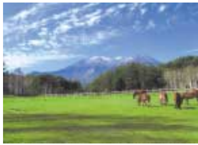
木曽馬の里：高原の放牧場では約30頭余りの木曽馬たちがのんびり草を食べて、乗馬体験を楽しむこともできる。

木曽は豊かな自然と水に恵まれた歴史の宝庫です。音楽祭会場になっている木曽駒高原から少し足を伸ばせば、木曽馬に乗ったり、ロープウェイで雄大な景色を眺めたり、古い街並を散策したりと楽しみがいっぱいです。また、そばや五平餅を味わうのも楽しみの一つです。演奏会の始まるまでの時間。魅力あふれる木曽の良さを堪能してみてはいかがでしょうか。