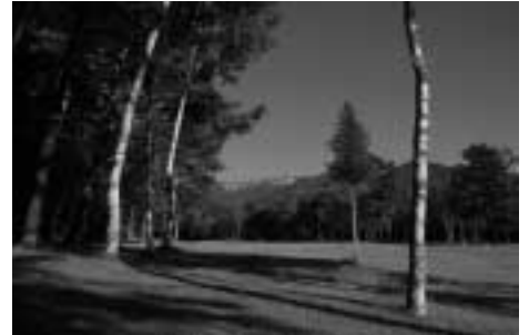
自然の起伏を活かしたゴルフ場 ゴルフ、キャンプ、フィッシングなど、 ネイチャースポーツフィールドのエリア としても楽しめます