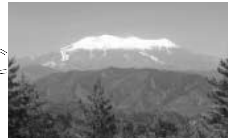
サンセットポイント「キビオ峠」 キビオ峠からの眺望