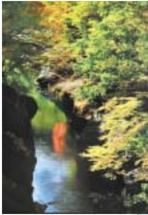
猿橋溪谷：開田高原から流れ来る西野川の水が岩盤を削ってきた溪谷。特に紅葉の時期は色づいた木々が清流に映り、見る人の心を和ませてくれる。