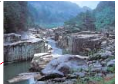
寢覚の床：木曽路を代表する名勝の一つ。木曽川の奇岩とエメラルドグリーンの水色が殊に美しい。浦島太郎伝説も残り、岩の上に祠・浦島堂がまつられている。