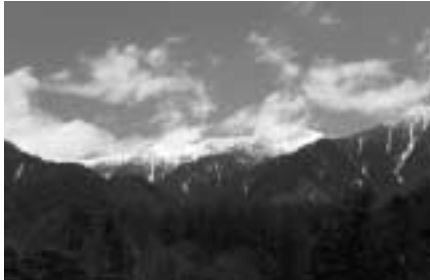
中央アルプスの主峰 木曽駒ヶ岳 「日本百名山」に数えられ、標高2,956mの山頂からは木曽御嶽山、南アルプス、富士山が一望できます

木曽駒高原は、標高1,000メートルの地に広がる爽やかな高原です。木曽駒ヶ岳からの清流が木曽川に注ぐこの山麓では、レジャー施設や別荘地、また木曽御嶽山が望めるスポットなどを回遊できます。木曽音楽祭が平成2年より、長年コンサート会場としてきている木曽文化公園は、この緑豊かな木曽駒高原の要に位置する施設です。