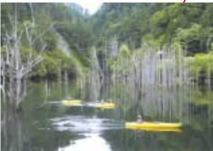
自然湖：長野県西部地震の際、土石流で川がせき止められてできた湖。幻想的な空間のカヌー体験が魅力。