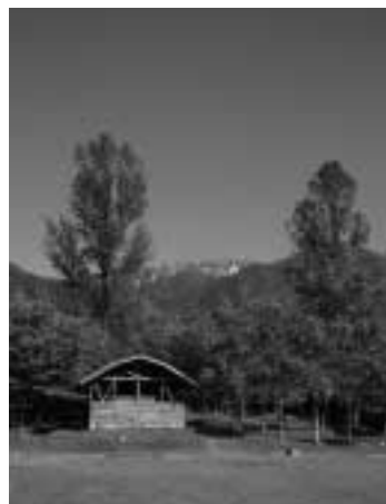
大地と遊ぶ 森林公園