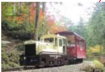
赤沢自然休養林の森林鉄道 森林浴発祥の地・赤沢自然休養林。木曽ヒノキなど樹齢300年を超える樹木の中を森林鉄道が走っている。