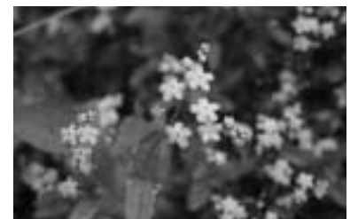
可憐な花との出会い 忘れな草—初夏から秋にかけて溪流沿いに咲く

権兵衛トンネル「権兵衛街道」開通5周年 中央道伊那ICから権兵衛トンネルを通ってくれば、約30分で木曽文化公園へ到着。 権兵衛トンネルから木曽谷へ出れば、すぐに木曽駒高原。クルマを降りてゆっくり散策を楽しむのもよし、エリアを広げて回遊するのもよし。旅の楽しみは広がるばかりです。