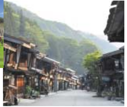
奈良井宿：難所・鳥居峠のふもとにあり江戸時代には「奈良井千軒」と言われるまでに栄えた宿場。「中村邸」「上問屋史料館」など重要文化財も多く残っている。