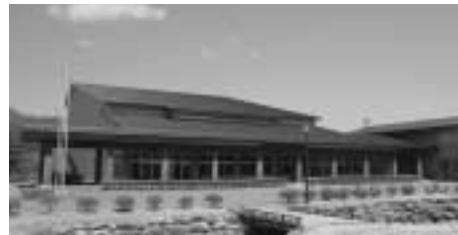
木曽文化公園 音楽祭会場となるコンサートホールの他に、研修施設、宿泊施設も隣接しています。開演時にアルプホルンの演奏が聴ける芝生の広場では、正面に木曽駒ヶ岳、振り返れば、霊峰木曽御嶽山を望む事もできます