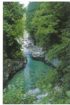
7 阿寺溪谷 木曾五木が茂る山が両岸に迫り、狸ヶ淵や犬帰りの淵など美しい溪谷美が続く。

木曾は豊かな自然と水に恵まれた歴史の宝庫です。音楽祭会場になっている木曾駒高原から少し足を伸ばせば、木曾馬に乗ったり、ロープウェイで雄大な景色を眺めたり、古い町並みを散策したりと楽しみがいっぱいです。また、蕎麦や五平餅を味わうのも楽しみの一つです。演奏会が始まるまでの時間、魅力あふれる木曾の良さを堪能してみたいはいかがでしょうか。