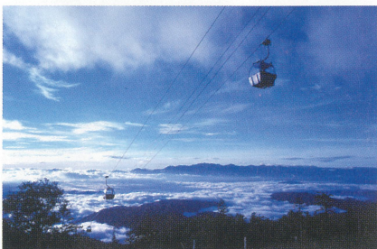
3 御岳ロープウェイ 標高3,067m、木曾のシンボル御嶽山。ロープウェイを利用して美しい景色を眺めたり、トレッキングを楽しむことができる。