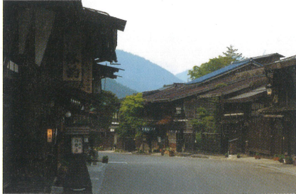
1 奈良井宿 難所・鳥居峠のふもとにあり江戸時代には「奈良井千軒」と言われるまでに栄えた宿場。「中村邸」「上問屋資料館」など重要文化財も多く残っている。