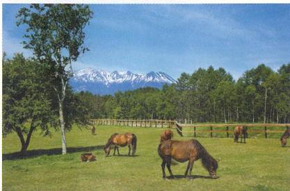
2 木曾馬の里 高原の放牧場では約30頭余りの木曾馬たちがのんびり草を食べていて、乗馬体験を楽しむこともできる。