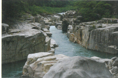
5 寝覚の床 木曾路を代表する名勝の一つ。木曾川の奇岩とエメラルドグリーンの水が殊に美しい。浦島太郎伝説も残り、岩の上に祠・浦島堂がまつられている。