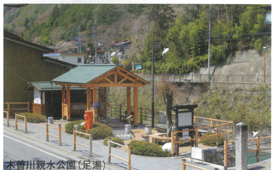
木曾川親水公園（足湯）