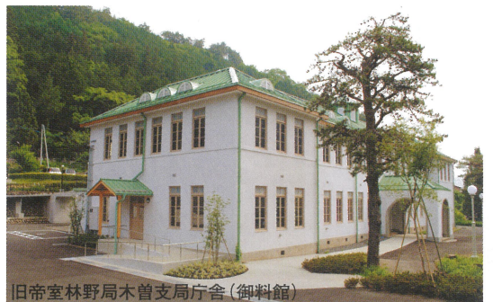
旧帝室林野局木曾支局庁舎（御料館）