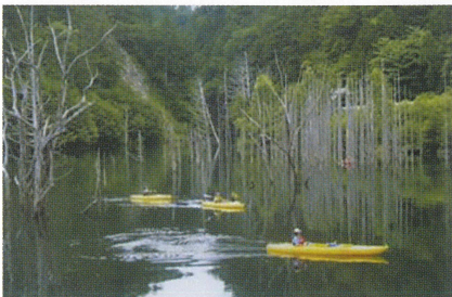
4 自然湖 長野県西部地震の際、土石流で川がせき止められてできた湖。幻想的な空間のカヌー体験が魅力。